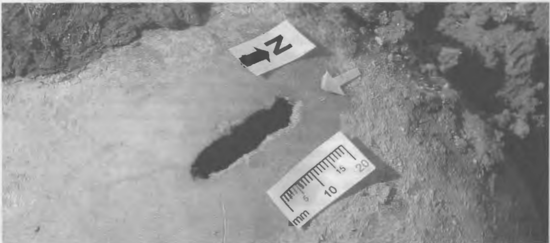
Figura 2. Algunas fracturas pueden ser provocadas por daños creados durante la excavación (o viceversa). Un antropólogo forense debe tener experiencia con varios tipos de trauma para determinar las diferencias entre trauma pre, peri y postmortem. En este caso, el trauma es el resultado de una bala que rozó el cráneo.

Normalmente, el antropólogo forense ha estudiado antropología física a nivel de postgrado, tiene experiencia en el análisis de esqueletos antiguos (i.e., arqueológicos) y entrenamiento y experiencia en la